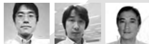
広報委員会メンバー Member of Public Relations Committee